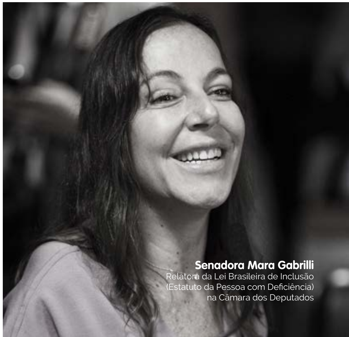
Senadora Mara Gabrilli

O que você tem em mãos hoje é uma legislação tão grandiosa quanto nossa luta. Tenho muita gratidão por ter sido eleita para viver esse momento e saber que, a partir de agora, 45 milhões de brasileiros passarão a ter direitos e poderão deixar de ser invisíveis.